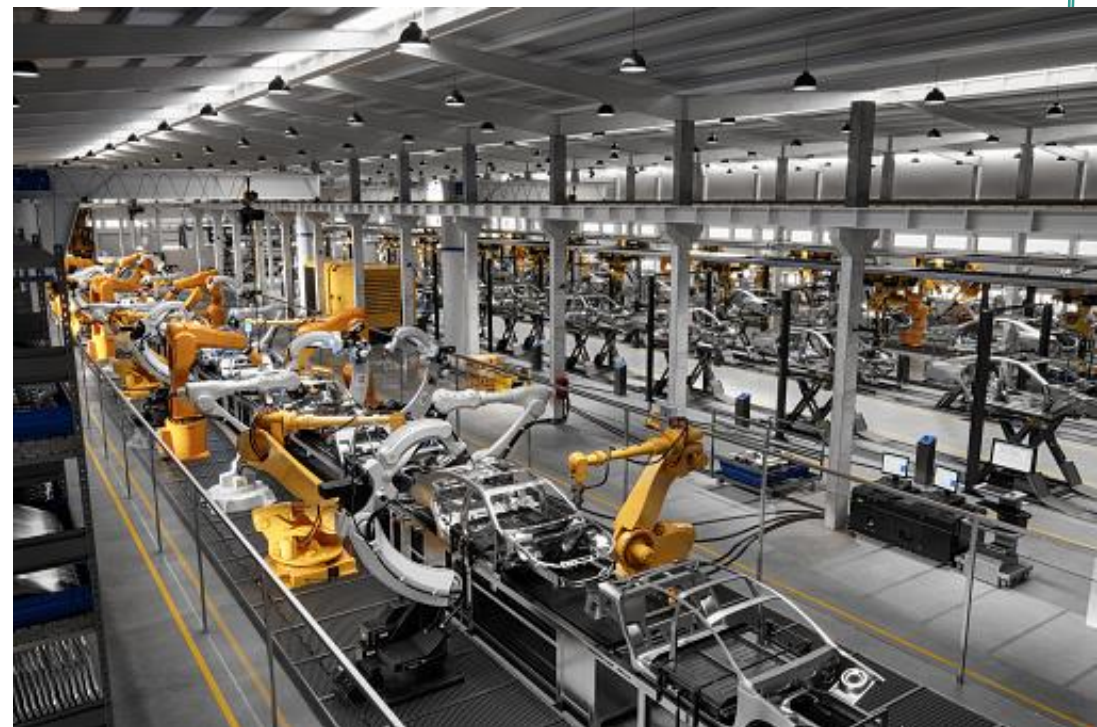
Imagem 9 – Automação