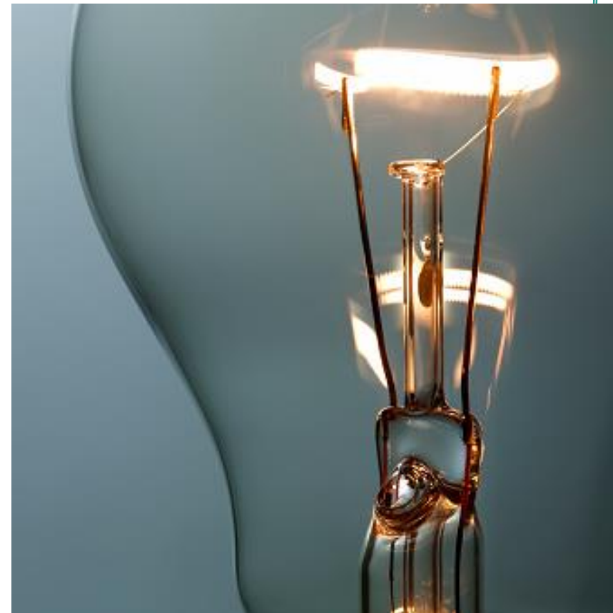
Imagem 5 - Lâmpada elétrica

A Segunda Revolução Industrial (entre 1850 e meados de 1945) é um termo utilizado para descrever um período de transformação econômica e tecnológica significativo, que ocorreu, principalmente, entre meados do século XIX e início do século XX.