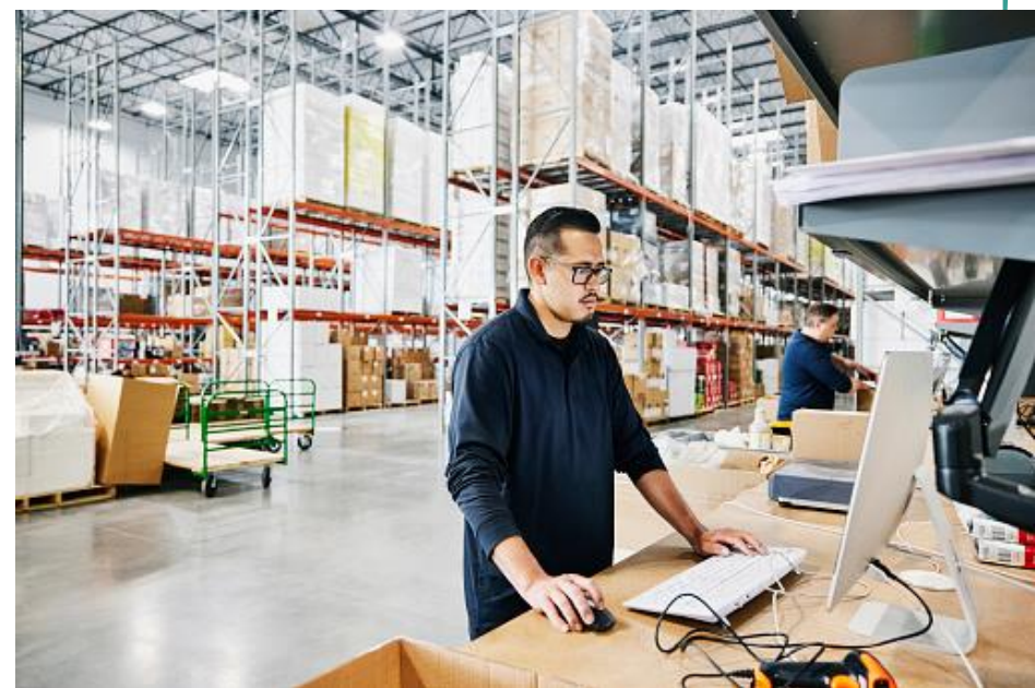
Imagem 8 – Setor industrial e o uso de equipamentos de informática

Também é conhecida como Revolução Digital ou Revolução da Tecnologia da Informação.