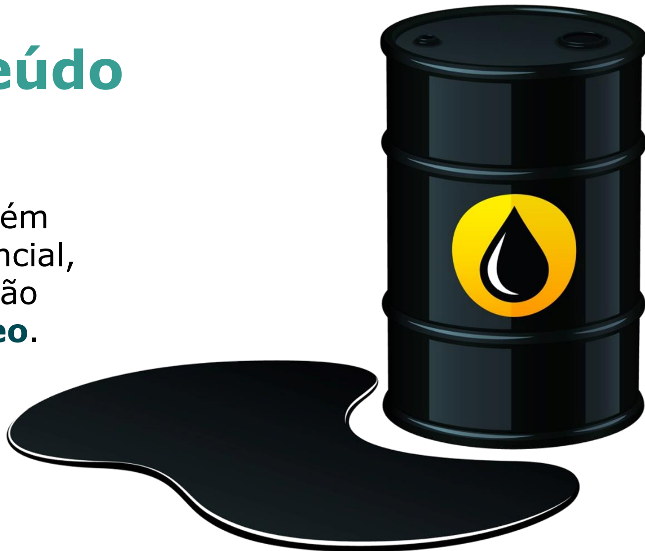
Imagem 6 – Barril de petróleo