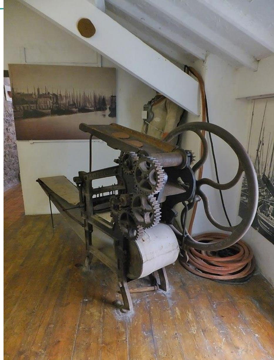
Imagem 1 – Maquinofatura

A Primeira Revolução Industrial se iniciou na Inglaterra, em 1760. Nesse período, a produção manufatureira passou a ser realizada pelas primeiras máquinas, como os teares ou máquinas movidas a vapor.