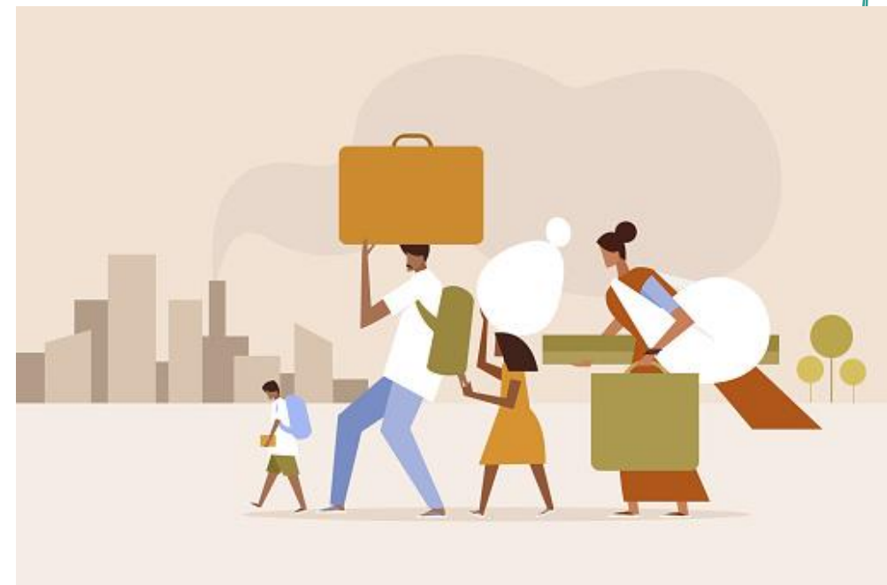
Imagem 10 – Migração populacional