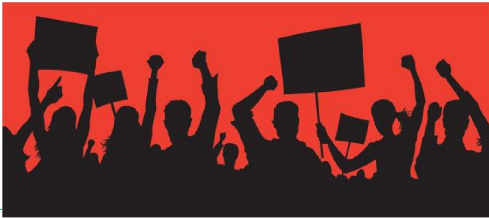
Imagem 3 – Movimentos trabalhistas

Os trabalhadores industriais, muitas vezes eram sujeitos a longas jornadas de trabalho , em média, 16 horas diárias, e submetidos a condições precárias . Passaram a realizar movimentos trabalhistas em busca de melhores condições de trabalho.