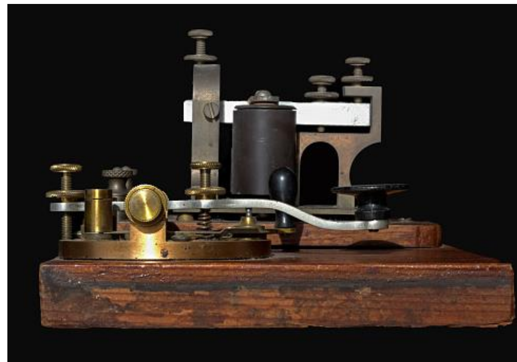
Imagem 7 – Telégrafo