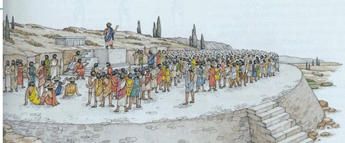
Ilustração da Eclésia, tipo de assembleia ateniense

A política tinha um papel fundamental na organização dessas sociedades . No campo da política, as decisões eram tomadas, as leis eram estabelecidas e as comunidades eram governadas . A participação ativa na política era considerada responsabilidade dos cidadãos . Os que eram considerados cidadãos tinham o direito de votar , discutir os problemas que impactavam a vida coletiva e propor contribuições que buscassem o bem-estar social .