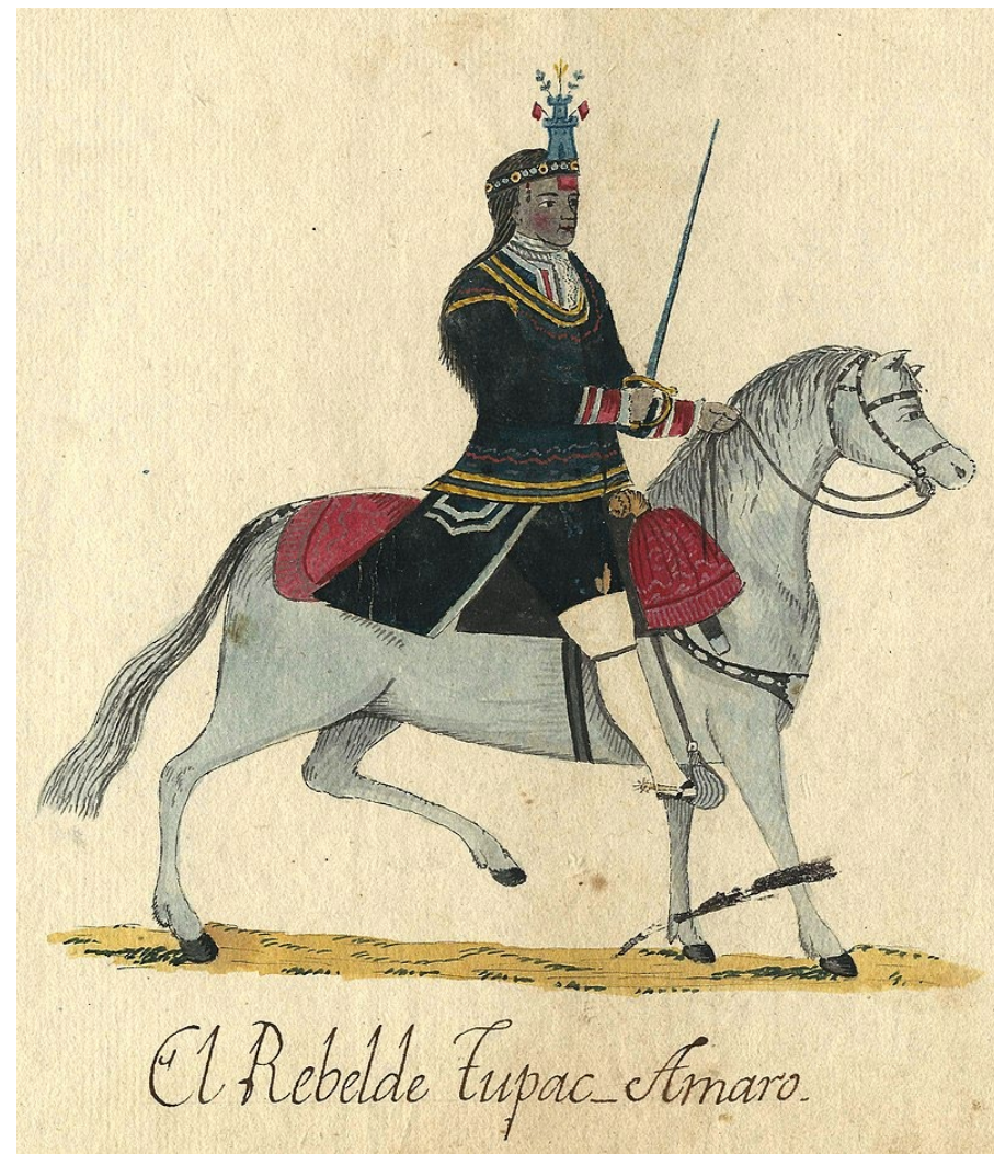
Aquarela retratando José Gabriel Condorcanqui, vulgo Tupac Amaru (1781-1800)

Vamos refletir... Como era Tupã Amaro? Como era o rosto dele? Como ele estava vestido? São perguntas para as quais dificilmente temos respostas.