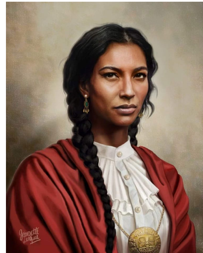
Micaela Bastidas Puyucahua

Ela aprendeu a ler e escrever com missionários católicos e se tornou uma líder respeitada em sua comunidade.