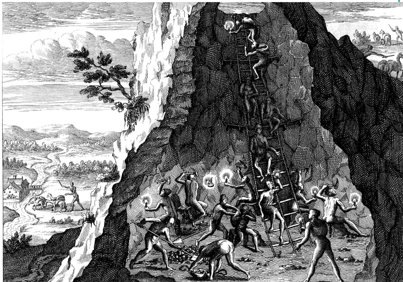
Mineração em Potosí

Apesar de ser uma minoria, essa parcela da população controlava tanto a vida econômica quanto a política do país.