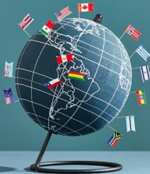
Imagem 3 – Bandeiras de países

É importante notar que a classificação de um país como potência mundial não é fixa e pode mudar ao longo do tempo, dependendo de fatores como a evolução econômica, política e militar, além de mudanças na ordem global.