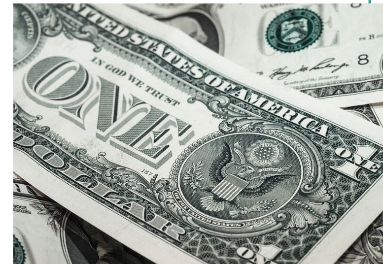
Imagem 1 – Nota de um dólar

A Imagem 1 refere-se à nota de 1 dólar, moeda que pertence aos Estados Unidos da América (EUA). Você sabe dizer o porquê de essa moeda ser tão utilizada por diversos países no mundo? Por que sua cotação é tão importante para as relações comerciais? Como o valor do dólar pode impactar sua vida e seu cotidiano?