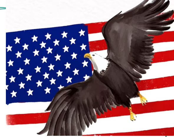
Imagem 4 – Águia e bandeira dos EUA