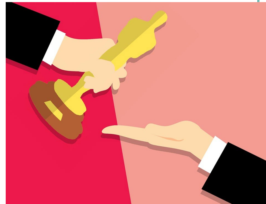
Imagem 2 – Estátua do Oscar