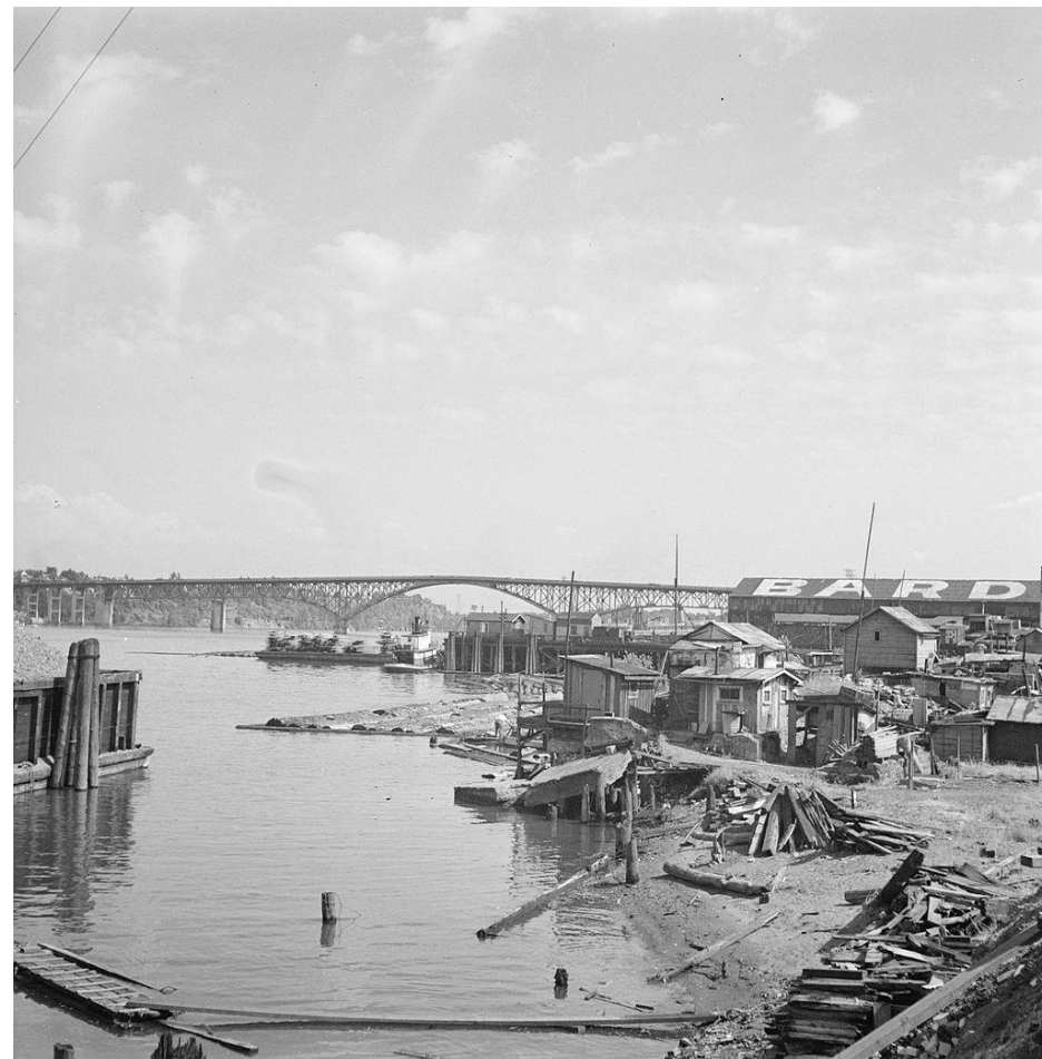
Uma das Hoovervilles surgidas durante a Grande Depressão, próxima a Portland, Oregon, Estados Unidos

A crise econômica espalhou-se rapidamente para outros países, afetando a Europa, a América Latina e a Ásia. Os efeitos da Grande Depressão foram sentidos por muitos anos, com altas taxas de desemprego, falência de empresas e queda na produção industrial.