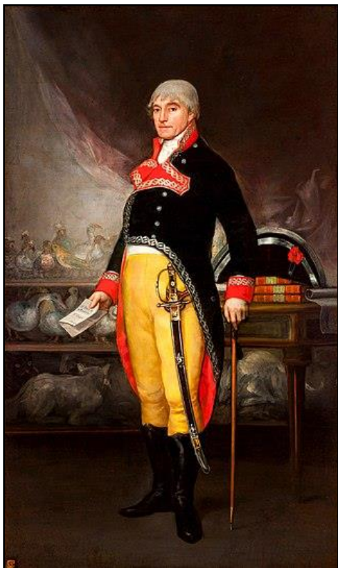
Félix de Azara

Dom João VI também tentou estabelecer relações comerciais com as colônias espanholas na América do Sul.