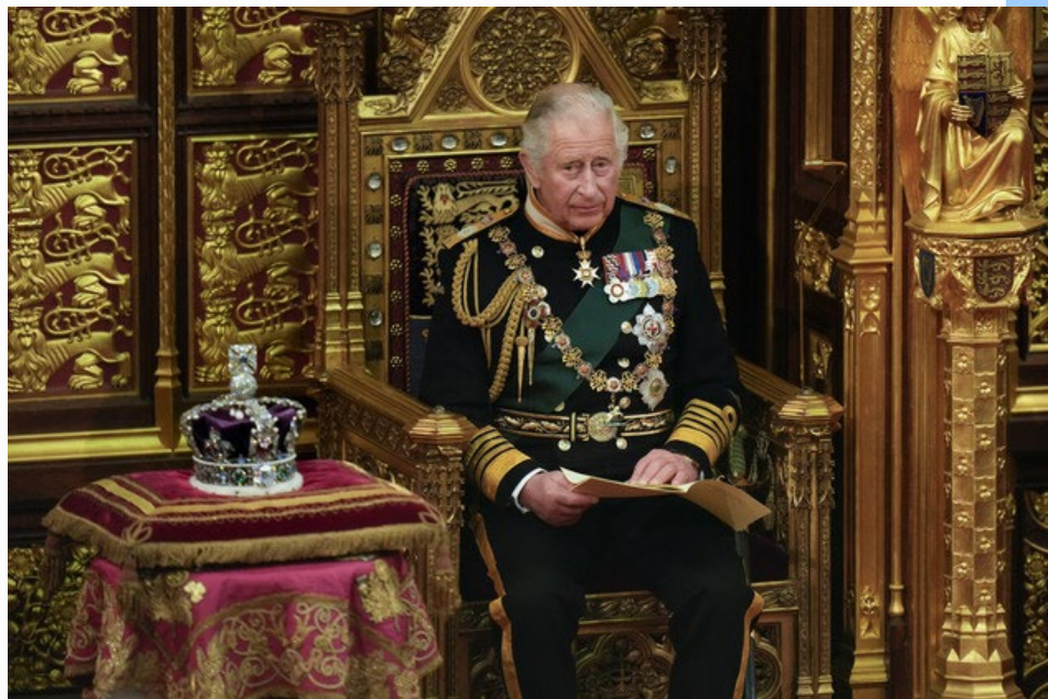
Coroação do Rei Charles III