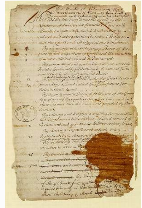
Bill of Rights

Tradução livre da Declaração de Direitos de 1689, feita especialmente para este Material.