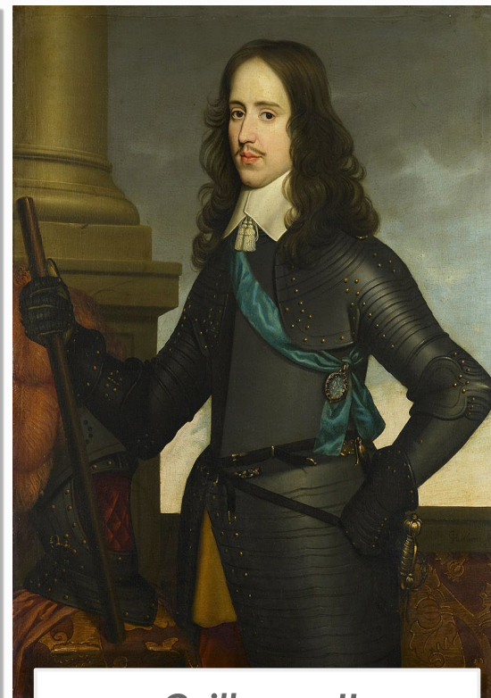
Guilherme II, Príncipe de Orange

SÃO PAULO (Estado). Currículo em Ação – 8o ano, 2023.