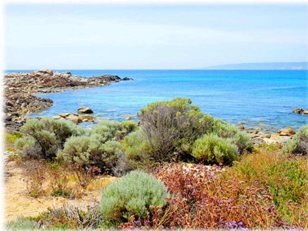
Imagem 9 – Vegetação mediterrânea, sul da Austrália

Típica das regiões de clima mediterrâneo , nas quais os invernos são chuvosos e os verões são secos e quentes. Essa vegetação se caracteriza por árvores de pequeno porte e arbustos adaptados ao período de pouca chuva. Na Oceania, essa vegetação predomina apenas no sul da Austrália.