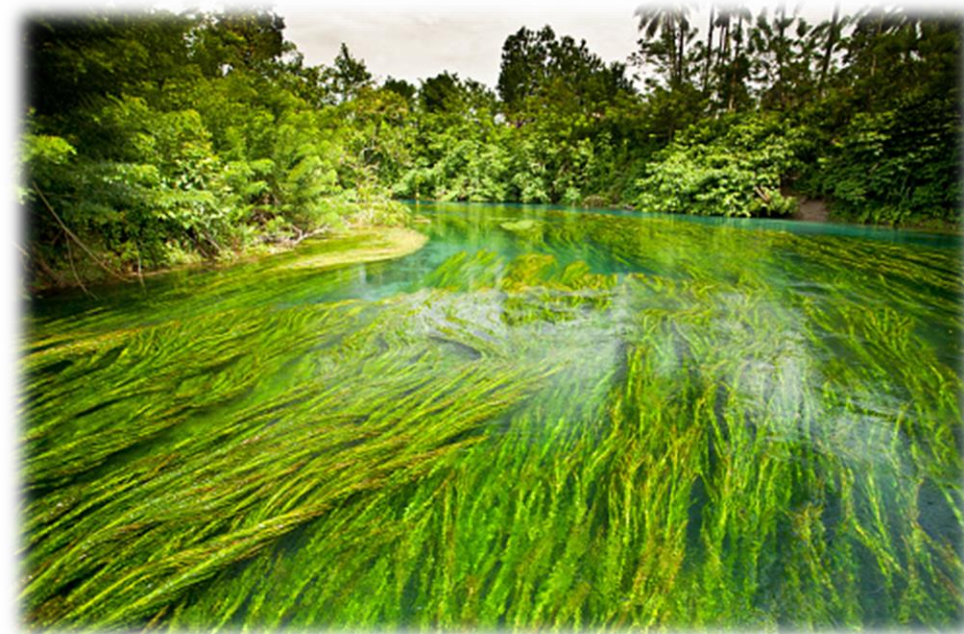
Imagem 6 – Floresta equatorial, Papua Nova Guiné

Caracterizada por uma vegetação densa e úmida, apresenta grande diversidade de espécies vegetais. Esse tipo de vegetação predomina na maior parte das ilhas desse continente (porção insular), como na Papua Nova Guiné, além do litoral norte e nordeste da Austrália, que tem elevados índices de pluviosidade durante quase o ano inteiro, ou seja, nas regiões localizadas entre as zonas equatoriais e tropicais, de clima equatorial .