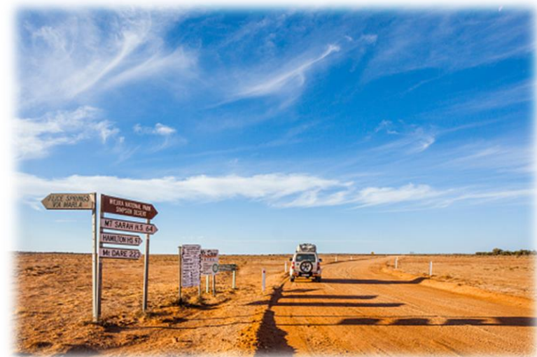
Imagem 11 – Vegetação desértica