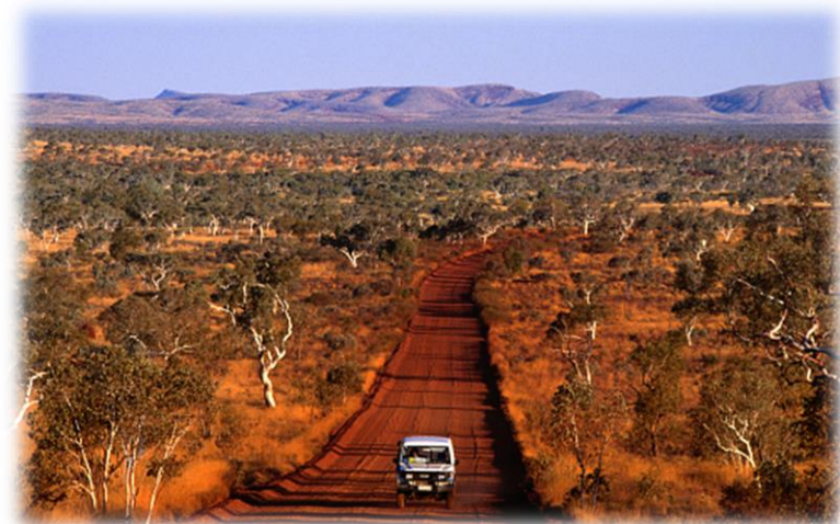
Imagem 10 – Estepes