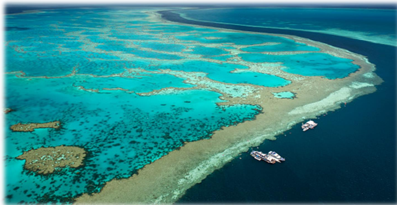
Imagem 4 – Grande Barreira de Corais, Austrália