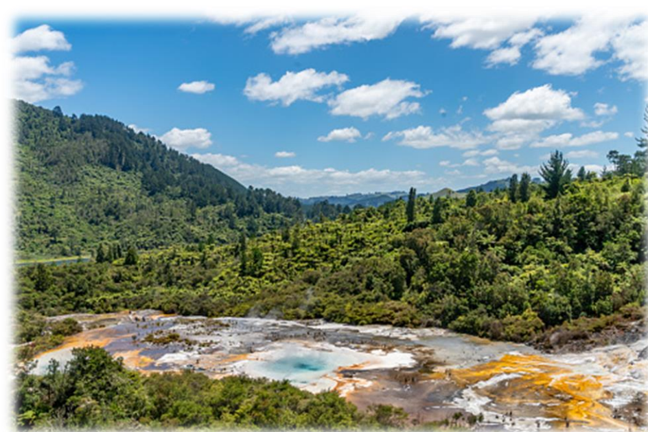
Imagem 8 – Floresta temperada, Nova Zelândia