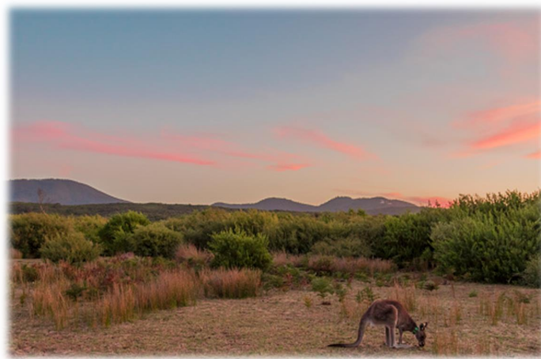
Imagem 7 – Savana, Austrália

Espécies como o canguru surgem com maior frequência nesse tipo de vegetação.