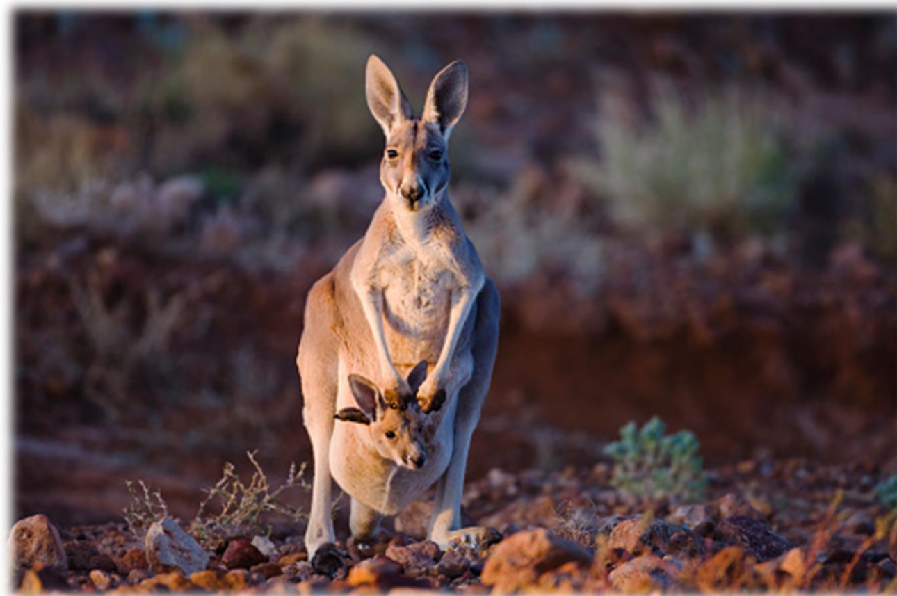
Imagem 1 – Cangurus nas savanas australianas

Quais outras espécies animais ou vegetais você conhece da Oceania?