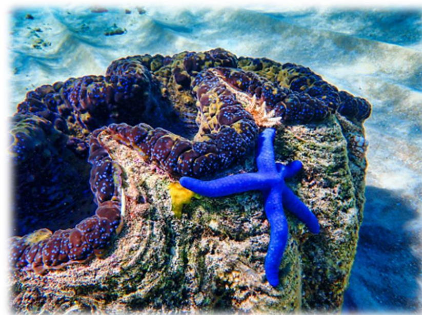
Imagem 3 – Biodiversidade na Grande Barreira de Corais

Em duplas, e com base em seus conhecimentos sobre impactos socioambientais no meio ambiente, listem alguns dos fatores que ameaçam a vida marinha dessa região. Discutam os resultados com seu/sua professor/a.