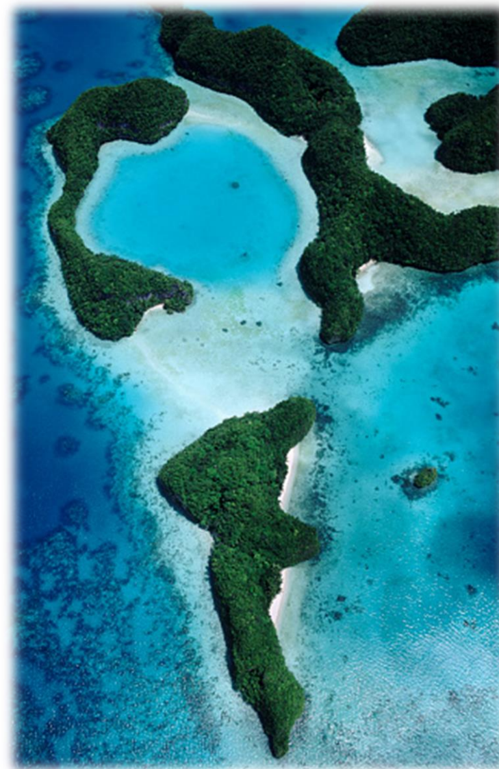
Imagem 5 – Ilha de Palau, Micronésia

A micronésia tem uma grande biodiversidade, explorada por mergulhadores de todo o mundo, como tubarões, peixes coloridos, algas exóticas e invertebrados.